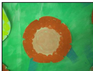
La fleur (assiette en carton et tampon)

L'action travaillée ici est de tamponner. Je pose et je lève comme quand je saute. Les outils sont plus ou moins couvrant par leur taille mais ne nécessitent pas de pression, d'appuyer "fort" pour laisser une trace. La préhension de l'enfant variera suivant l'outil. Le tampon à doigts permet de viser et donc d'apprendre le geste facilement, lorsque l'enfant relève son doigt un dessin apparaît. La validation du bon geste est automatique. Le tampon à prise incluse (le rose et noir) permet en début d'année un bon apprentissage du geste et une précision de pointage (coordination œil-main). On évolue ensuite vers des tampons "à manche" puis on utilise le coton tige qui permet une précision de pointage importante mais qui ne peut servir à recouvrir une grande surface.